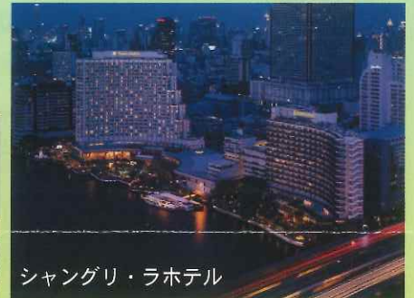
シャングリ・ラホテル