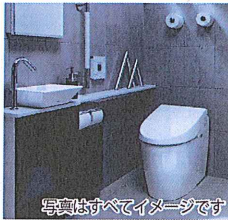
写真はすべてイメージです