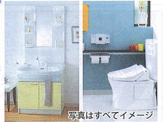
写真はすべてイメージ